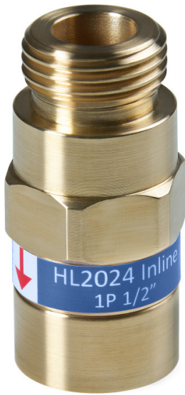
Arriba izquierda: HL2024 Inline 1P 1/2" m-f Abajo derecha: HL2024 Inline 1P 1/2" m-f - dimensiones (en mm)